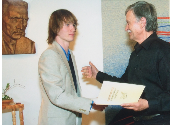
JUHAN LIIVILE PÜHENDATUD LUULEKONKURSS

Samuti on oluliseks põhjuseks see, et on olnud inimesi, kes on mehele andnud mõista, et see on tulevikus amet, mis talle sobib ning tal on sellele ametikohale potentsiaali. „Sa võid ju ise unistada,