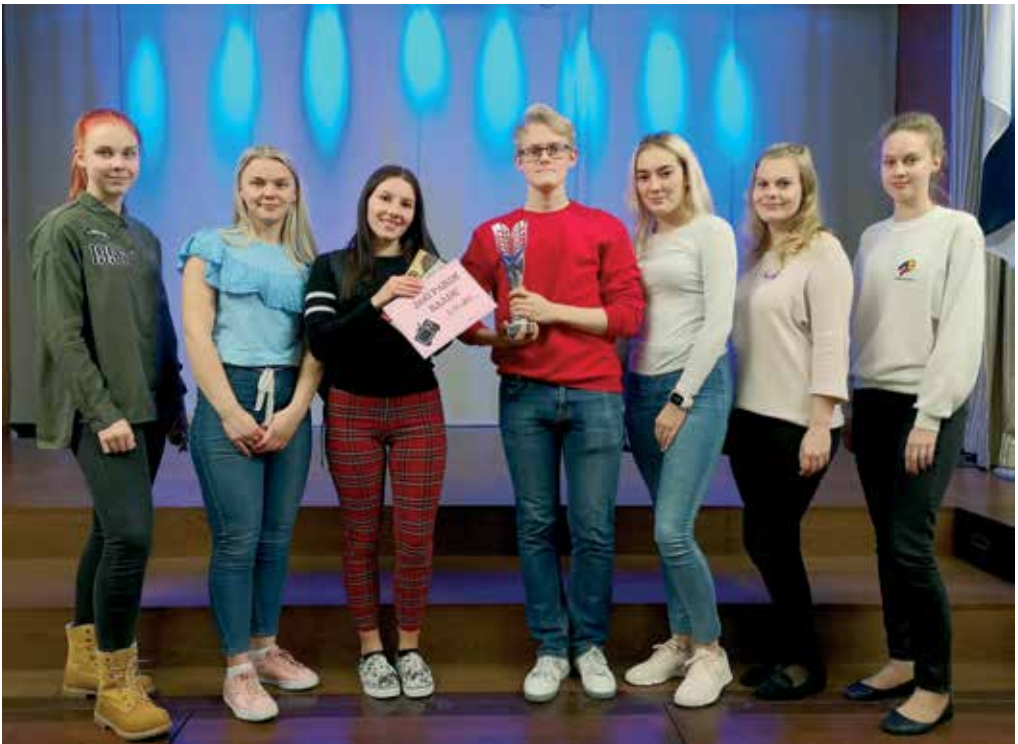
Salongiõhtu “JmG parim saade” võitis L-klass saadete popurriiga “Kanal L”