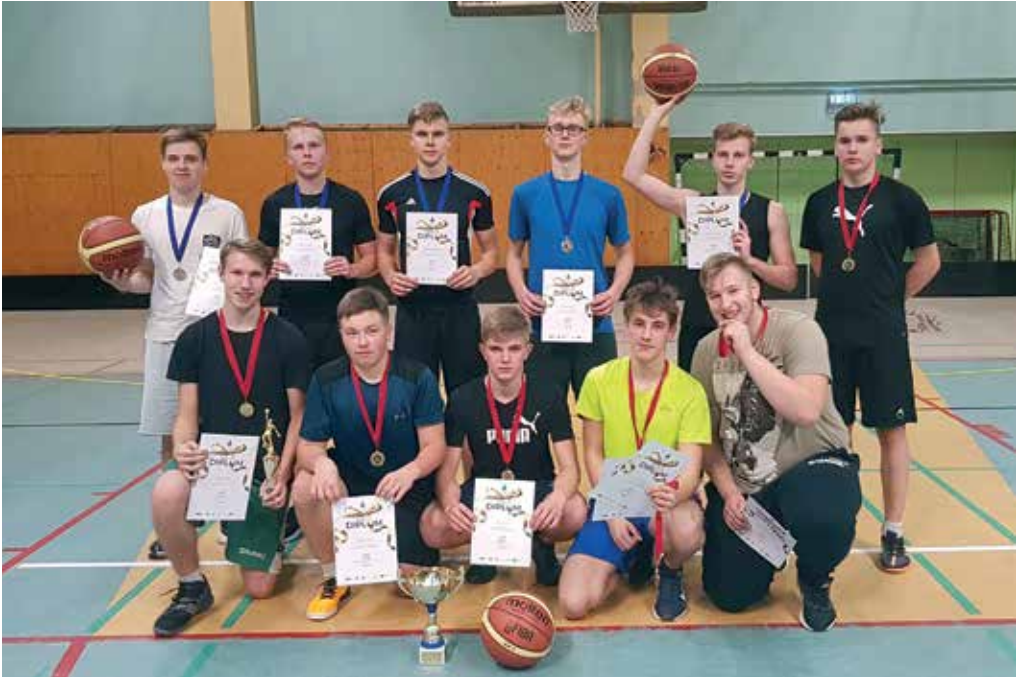
Korvpalliturniiril osalenud O/N- ja P/R-ühisvõistkonnad