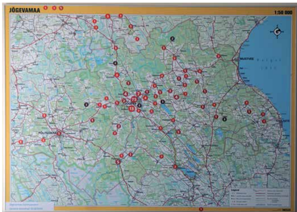
Õpilaste elukohakaart 2018/2019. õppeaastal