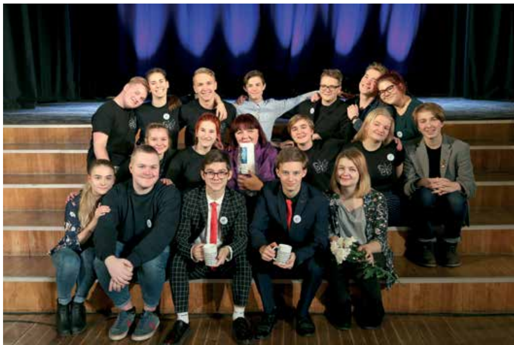
Luulepäevadelt “Tähetund” tuli Liblikapüüdjale laureaadi tiitel.