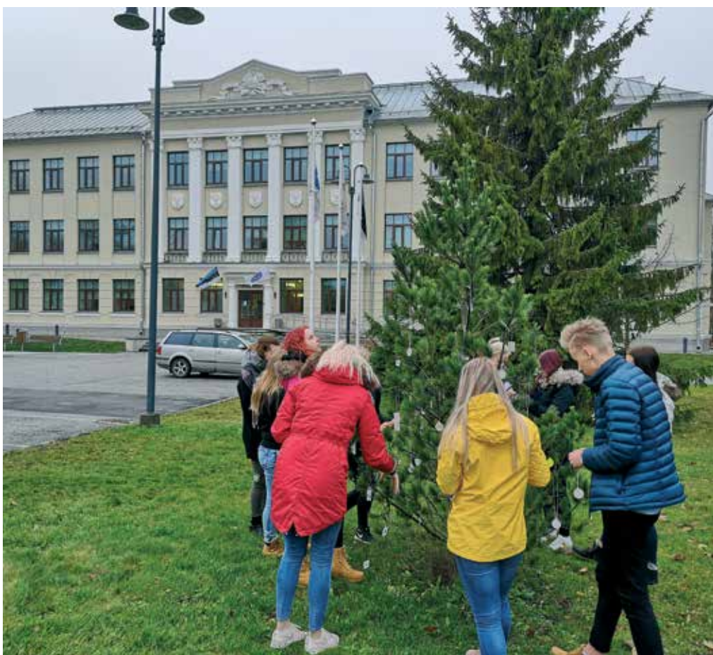
Ole nähtav – kooli õpilasesinduse eestvedamisel valmis helkuripuu