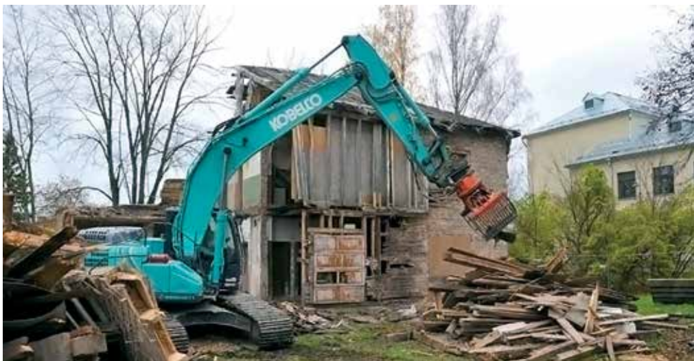
Kooli naabermaja, kus kunagi asusid tööõpetuse klassid, lammutamine.