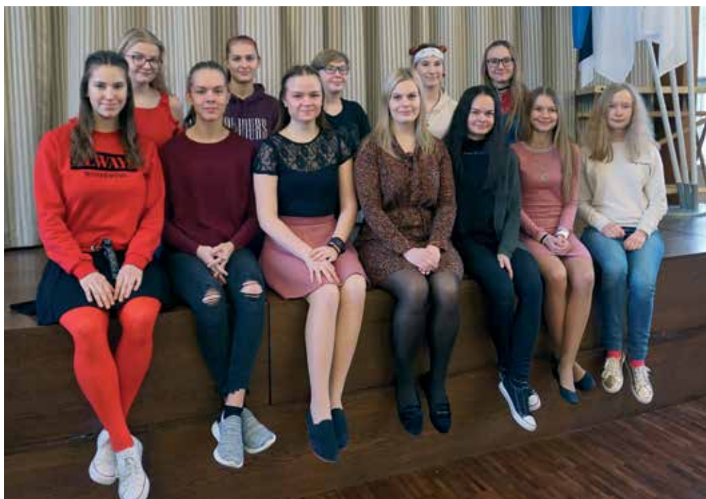
Piirkondliku emakeeleolümpiaadi parimad ...