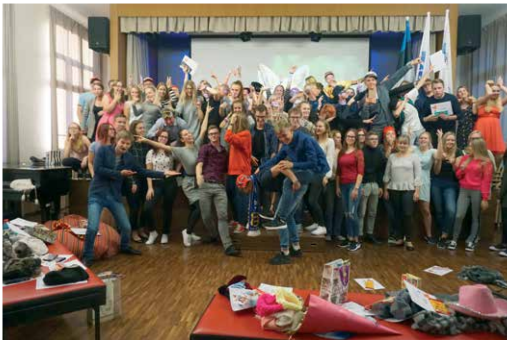
Õnnelikud Rebased ja nende Jumalad