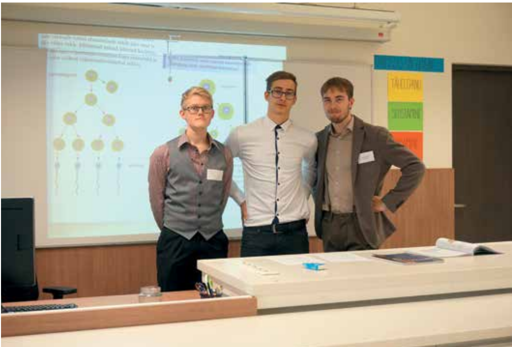
Õpetajaamet toob naeratuse näole