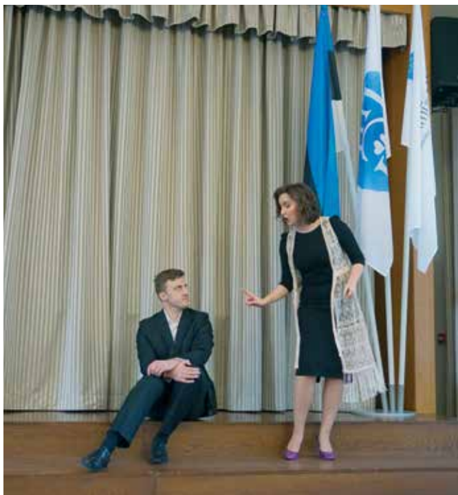
Muusikanädala kontserdid: “Hitid ooperist muusikalini” ja ...