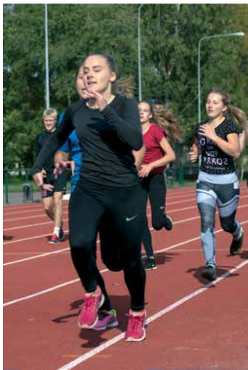
Kiiremini ... kõrgemale ... kaugemale ...