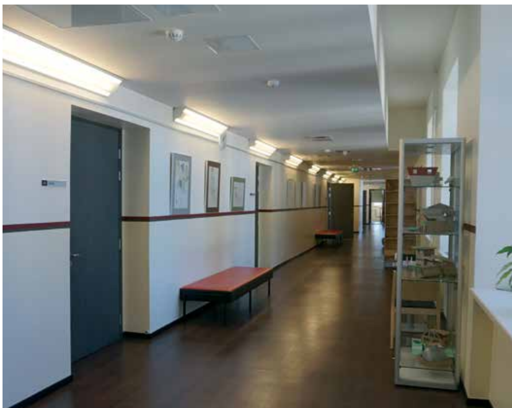
Teise korruse koridor enne ja nüüd