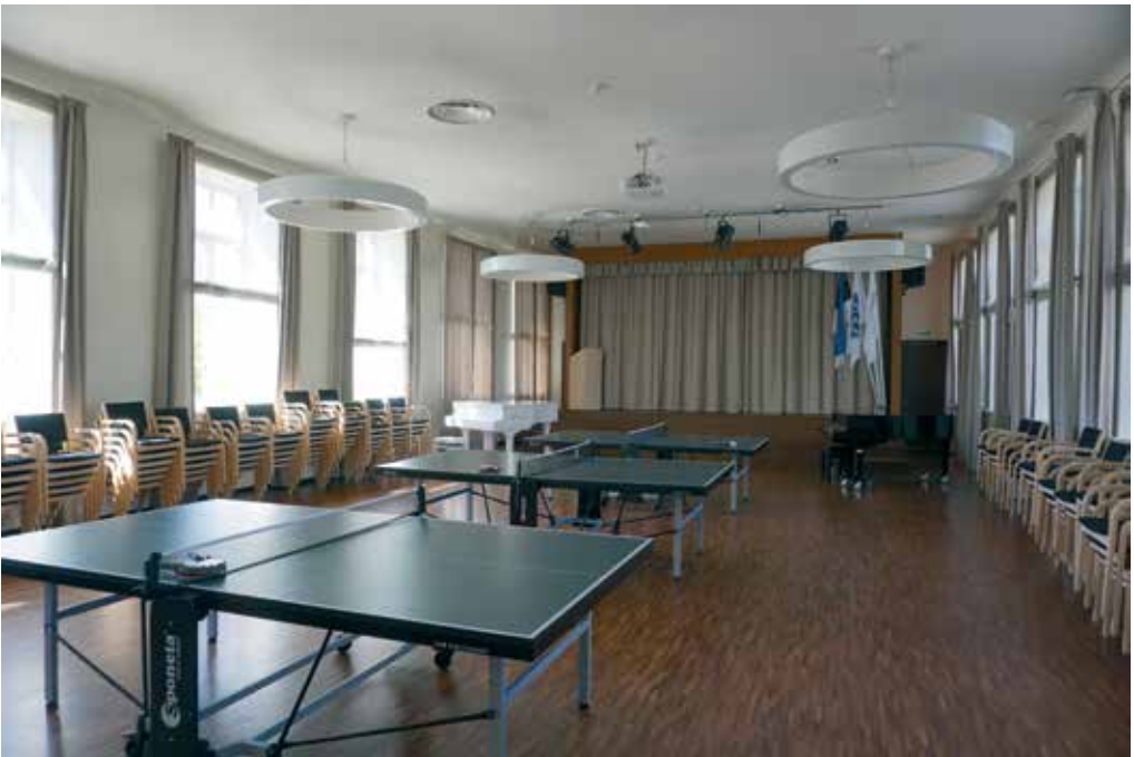
Aula enne ja nüüd