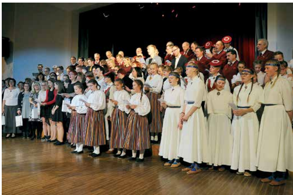
Heategevuskontsert lõppes ühislauluga