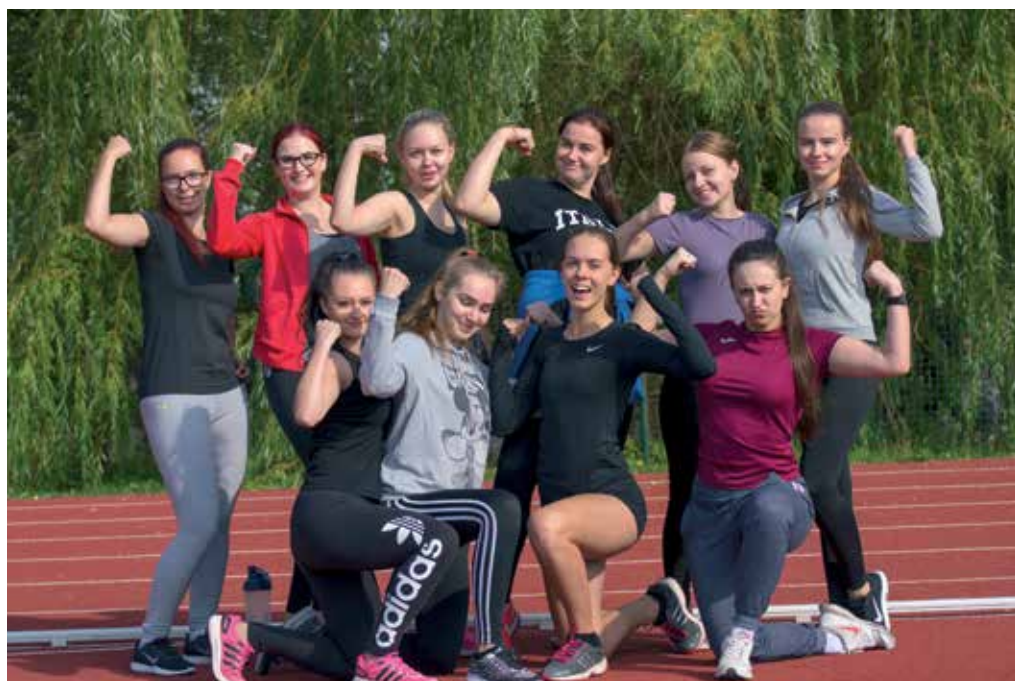
Nii see sügisene spordipäev kulges