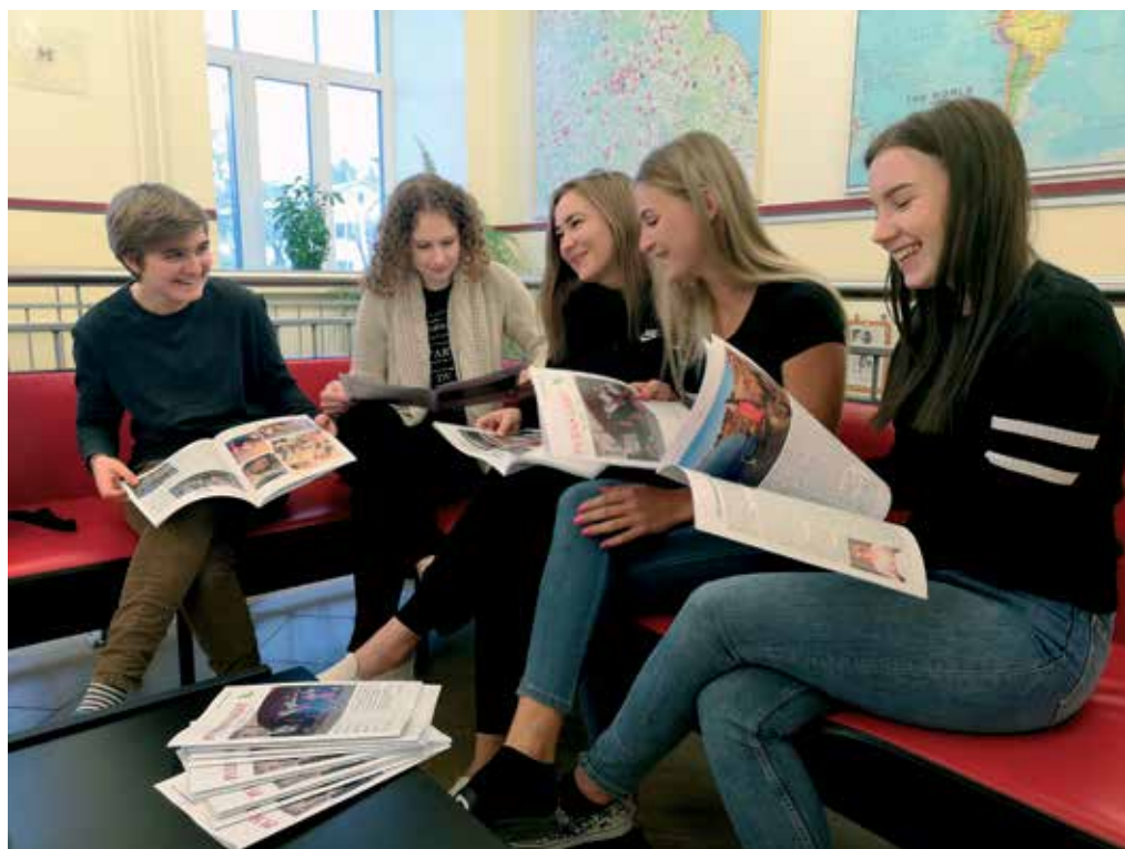
Trükisoe Puhas Leht