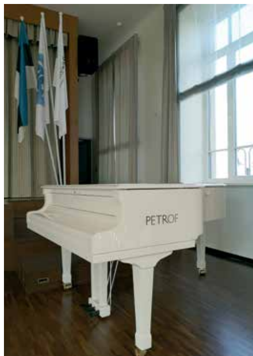
Uus iludus nimega Petrof