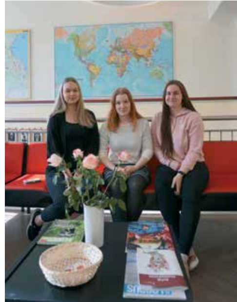
... geograafiaolümpiaadi parimad