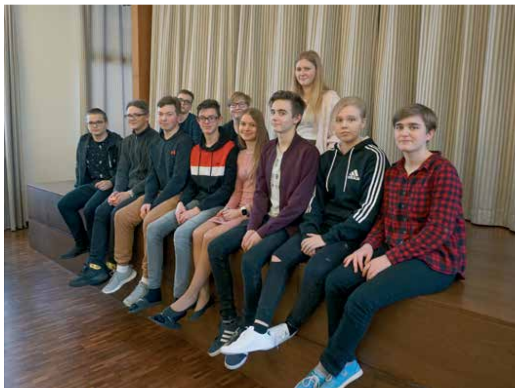
... ja matemaatika parimad