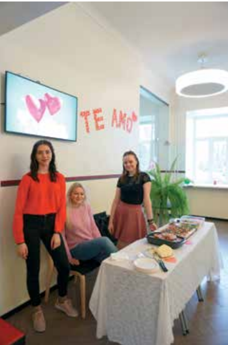
Sõbrapäevakohvik Te Amo