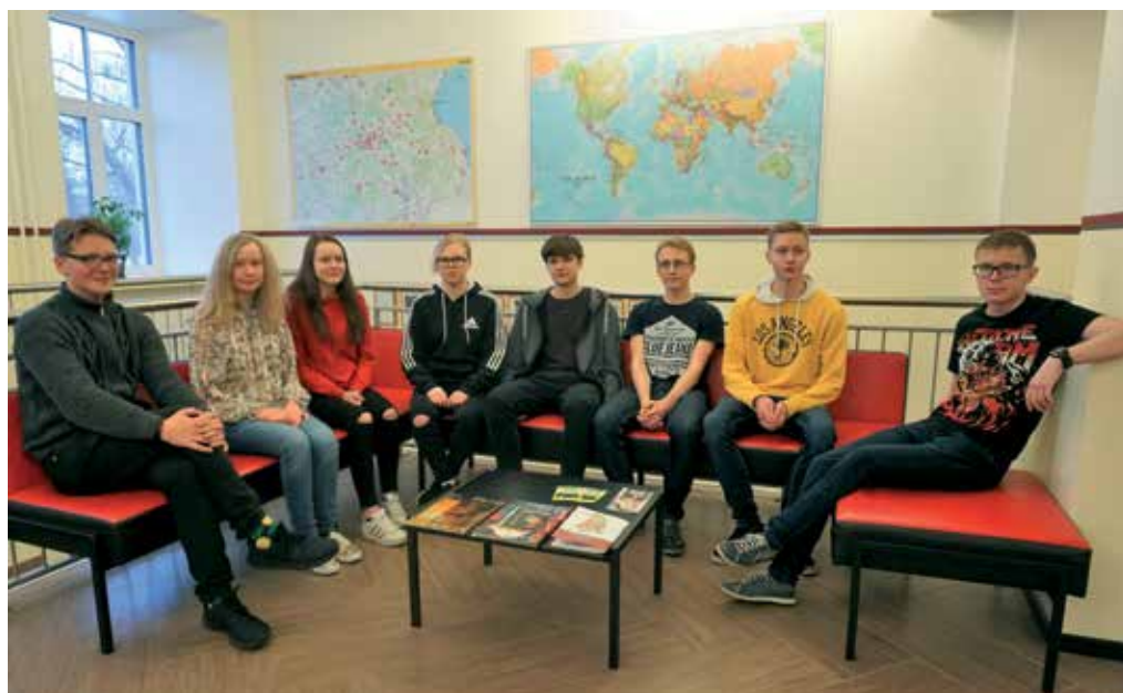
... ja ka inglise keele olümpiaadi parimad