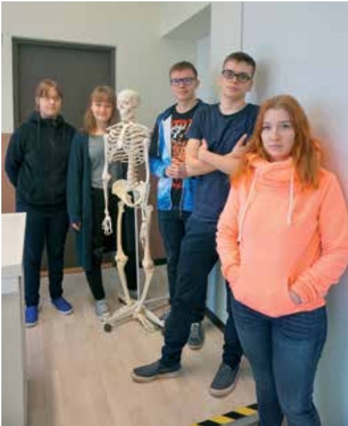
Piirkondliku bioloogiaolümpiaadi ja ...