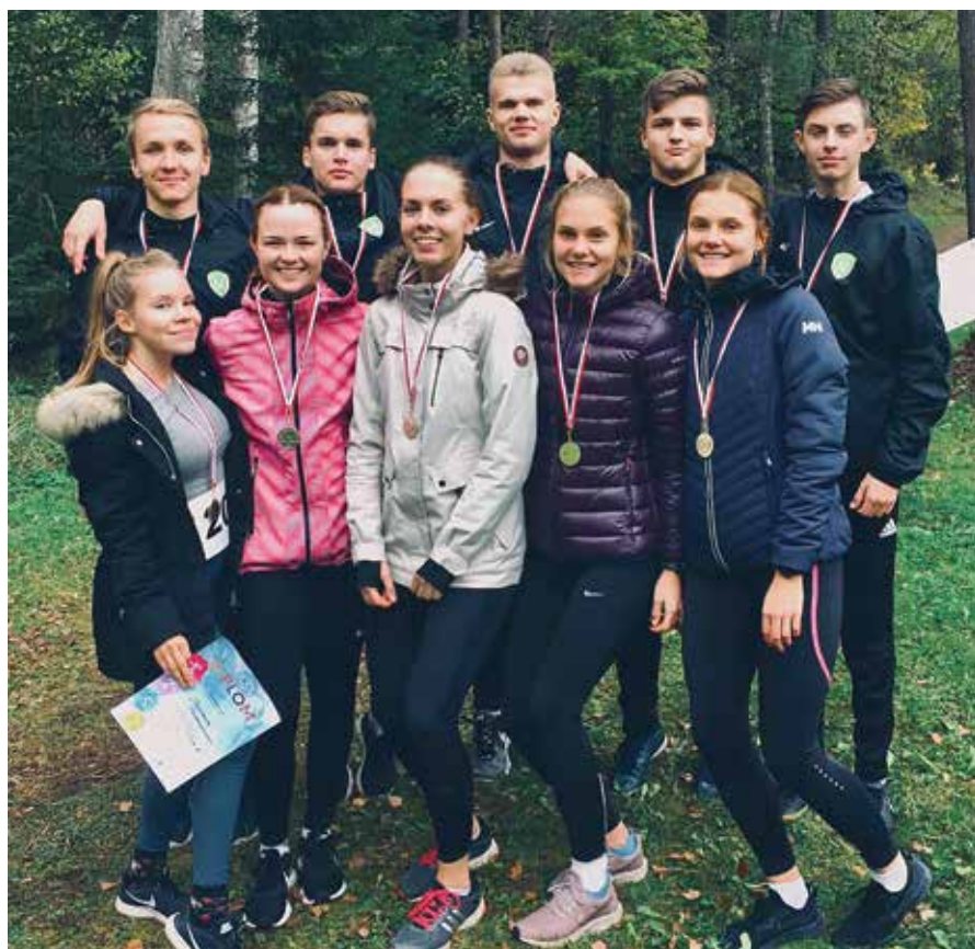
Eesti Koolispordi Liidu meistrivõistlused teatejooksudes, koondarvestuses saavutati II koht