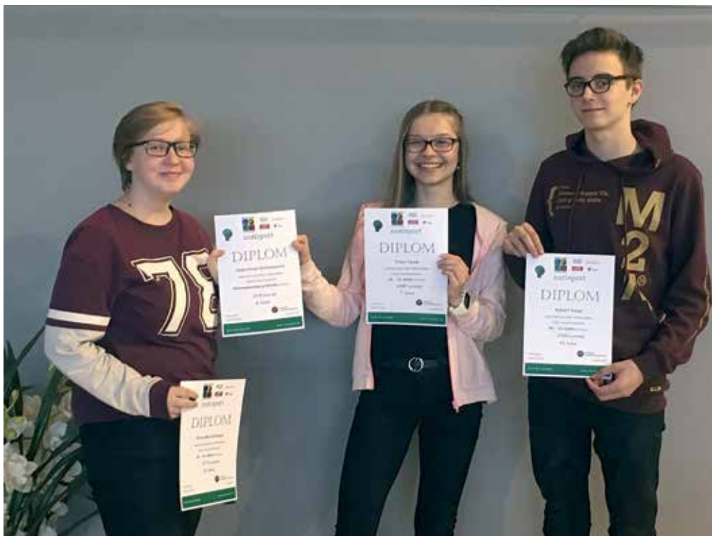
Meeskondlikult saavutati Nuti-Mati matemaatika Eesti karikavõistlustel gümnaasiumide ja tiimide arvestuses 4. koht