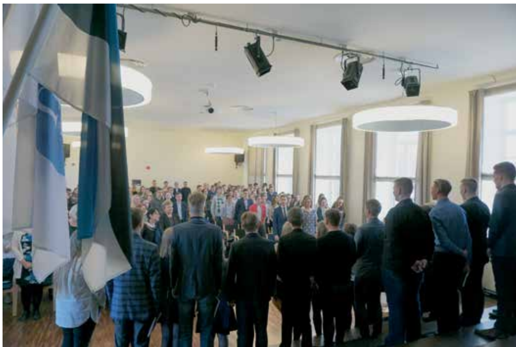
Eesti Vabariigi sünnipäevaaktusel lauldi...