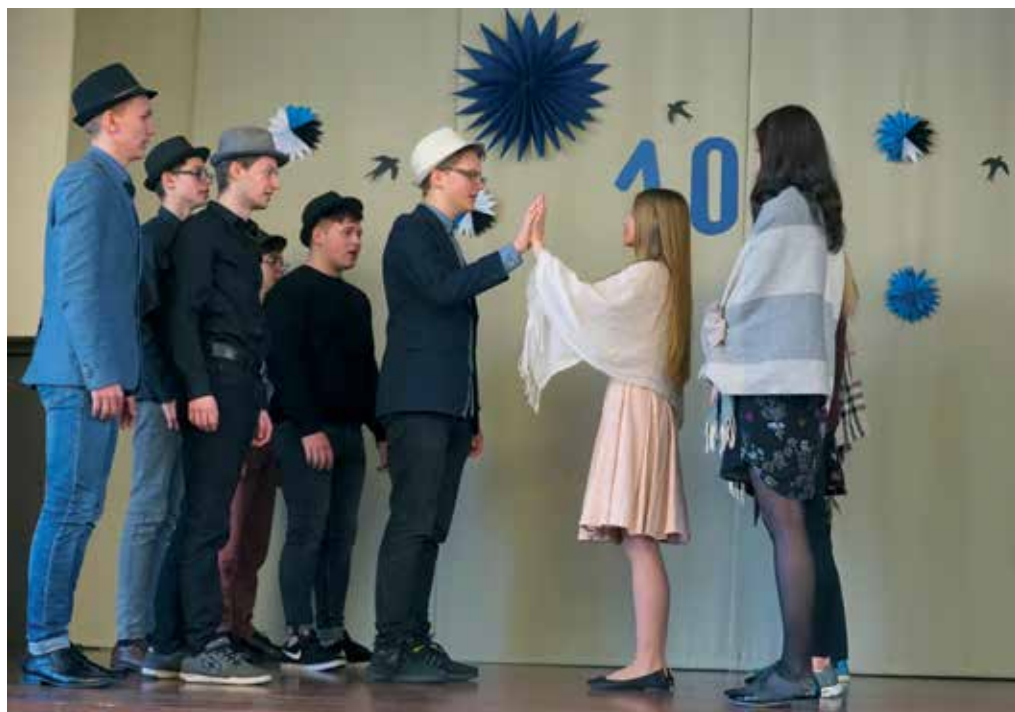
... ja näideldi