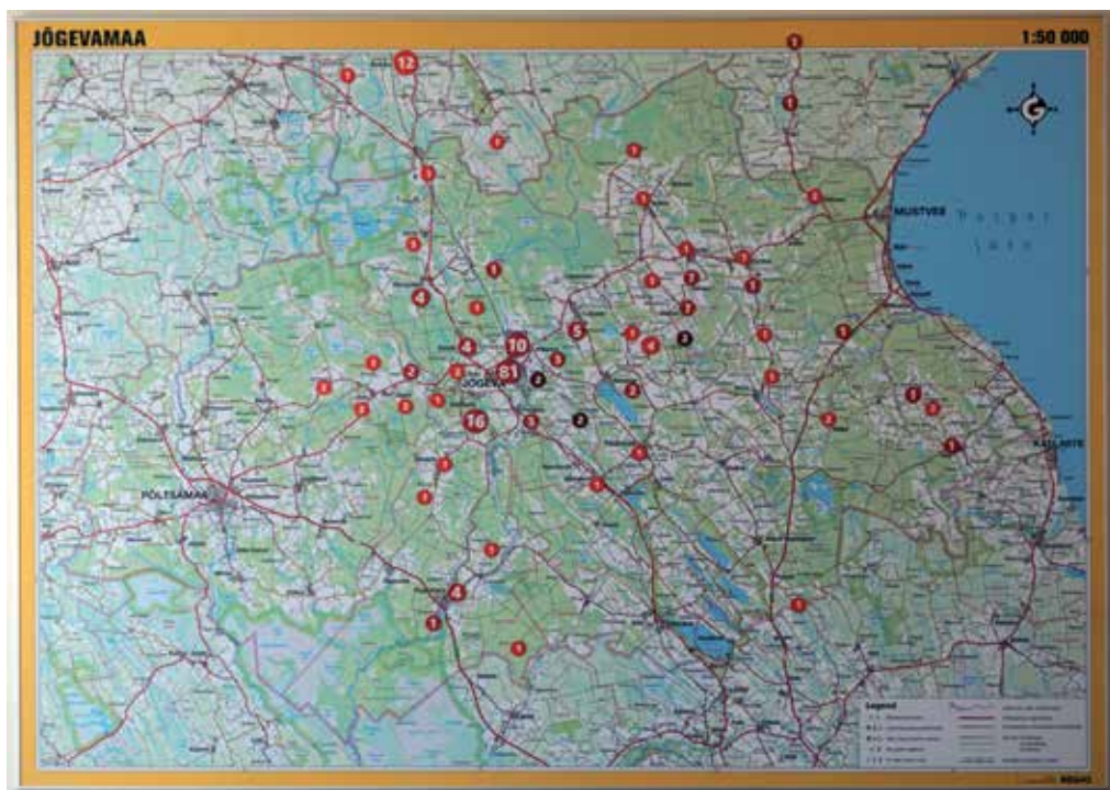
Õpilaste elukohakaart 2017/2018. õppeaastal