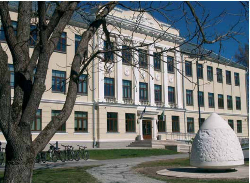
Jõgevamaa Gümnaasiumi hoone enne ja pärast renoveerimist