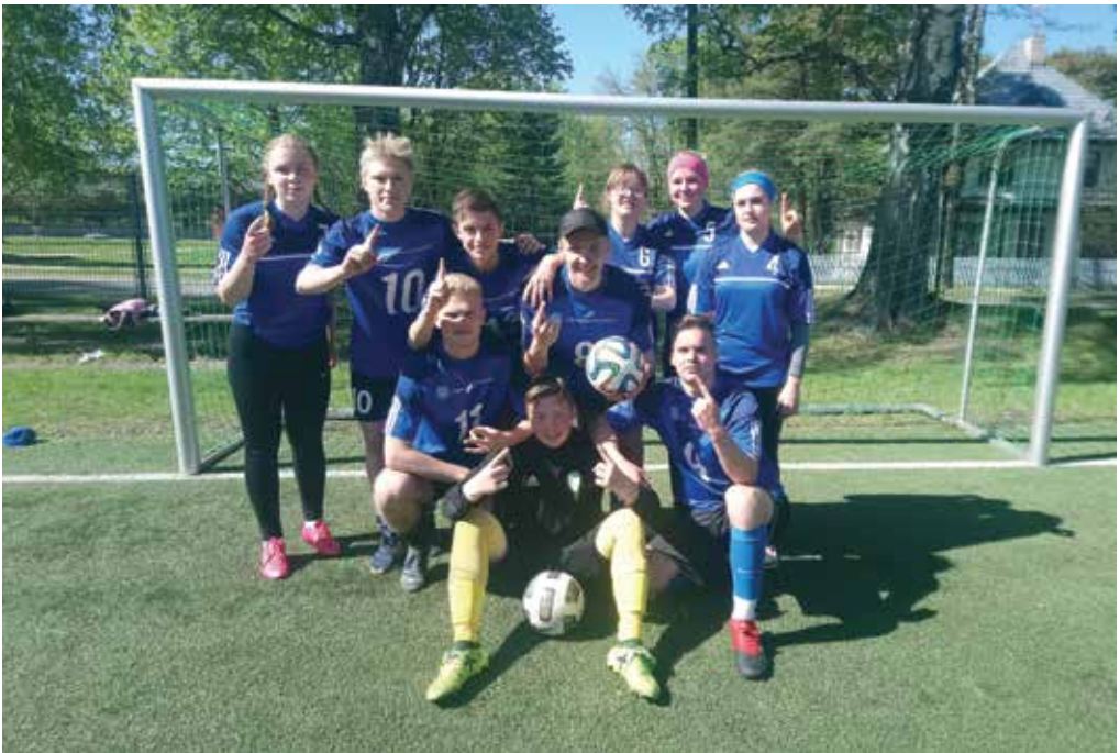
I koht riigigümnaasiumidevahelisel jalgpalliturniiril