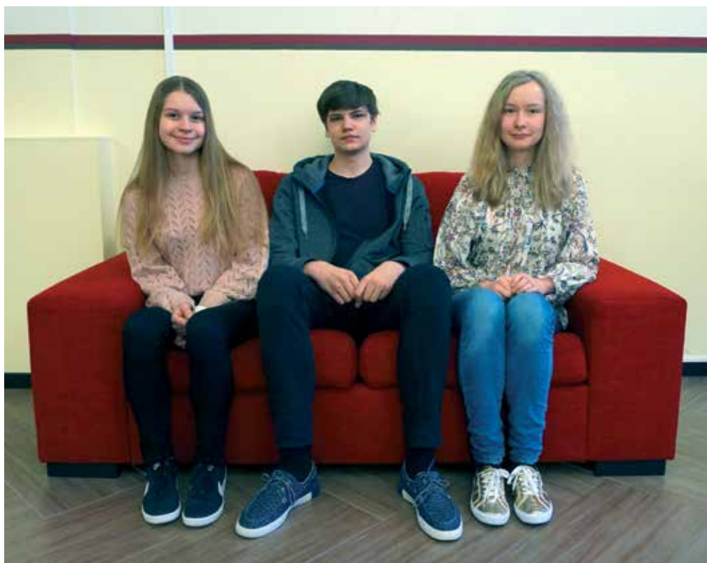
Saksa keele piirkondliku olümpiaadi ...