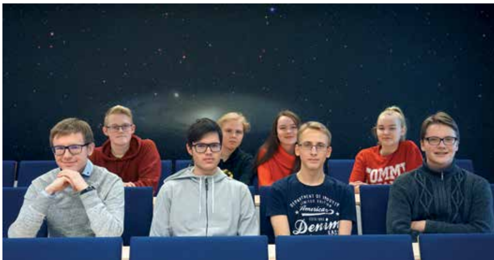
Meie tublimad inglise keele Euroopa Liidu olümpiaadil Best in English