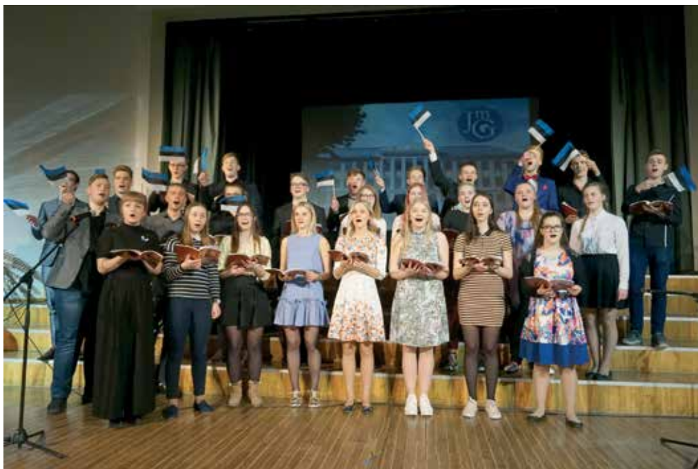
Meeleolukaid ja ...