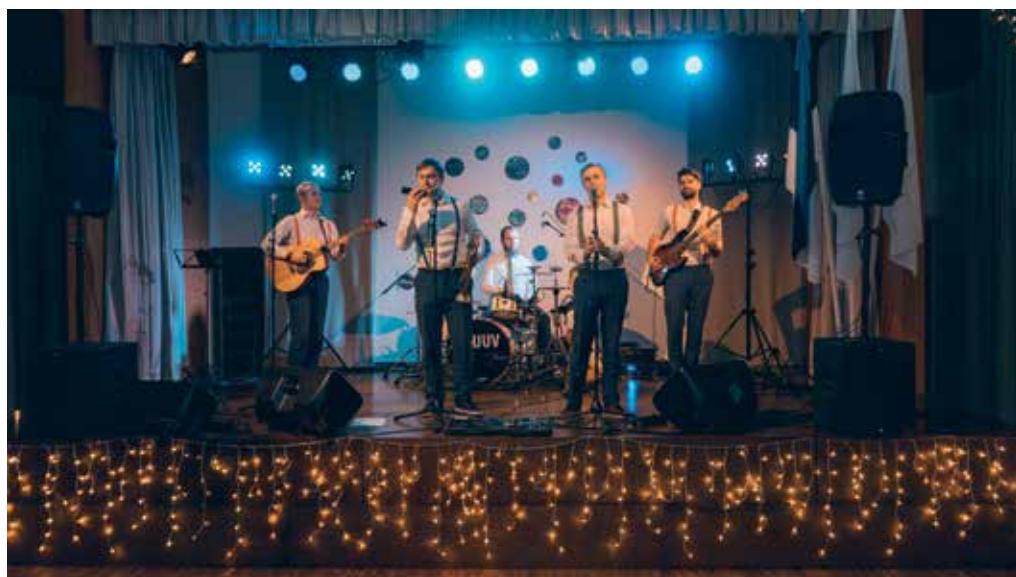
Jõuluballil tantsutas rahvast ansambel Kruuv.