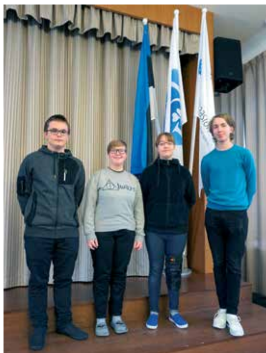
Ülitublid õpilased saavutasid uhkeid tulemusi piirkondlikel olümpiaadidel füüsikas...