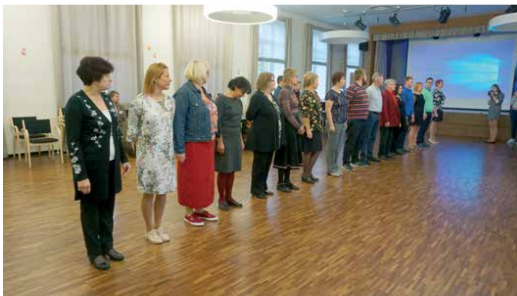
Sel ajal kui abiturientid tunde andsid, rivistati õpetajad hoopis aulasse