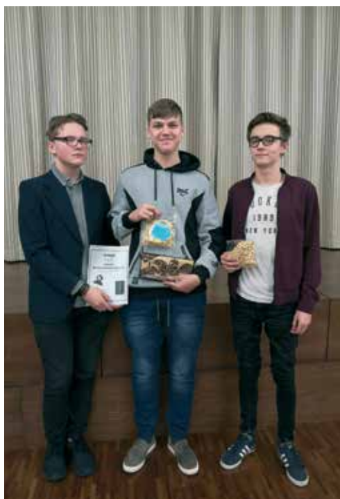
Salongiõhtu "JmG kõige humoorikam õudukas 2019" – Q-klass ja "Sõbrarvar"