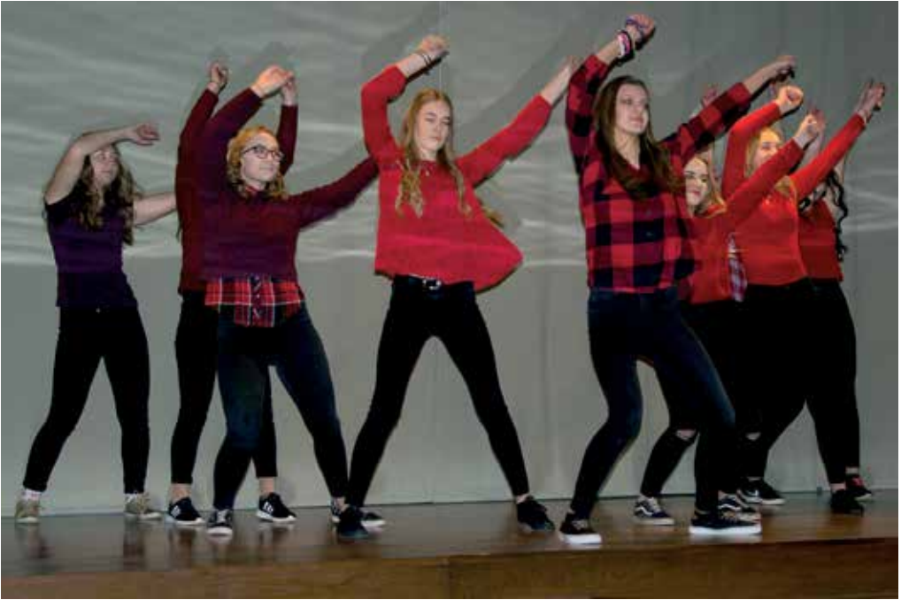
Jõulupäeva hommik algas tüdrukute tantsukavadega ...