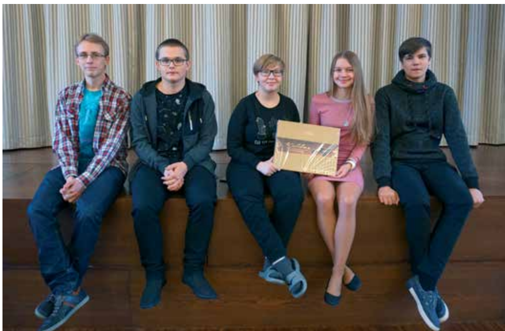
Teadusvõistlusel „Nupp nokib“ osalenud võistkond