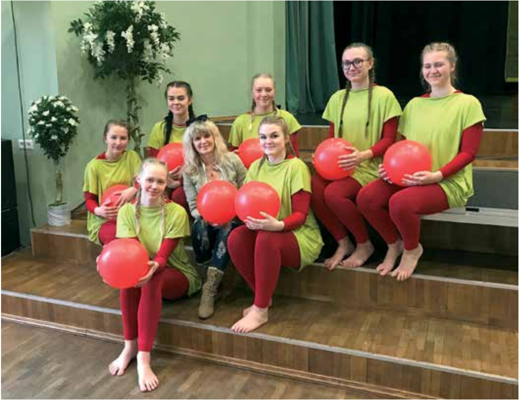
Tantsupidu, siit me tuleme! Neiduderühm pääses peole.