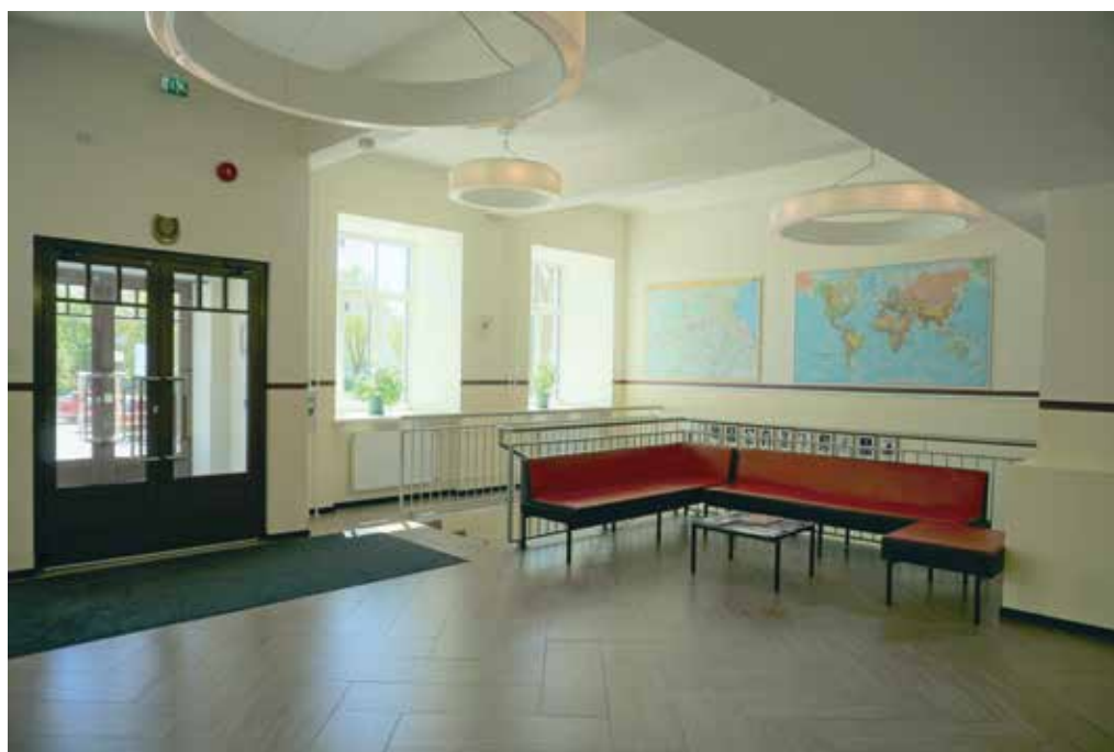
Fuajee enne ja nüüd