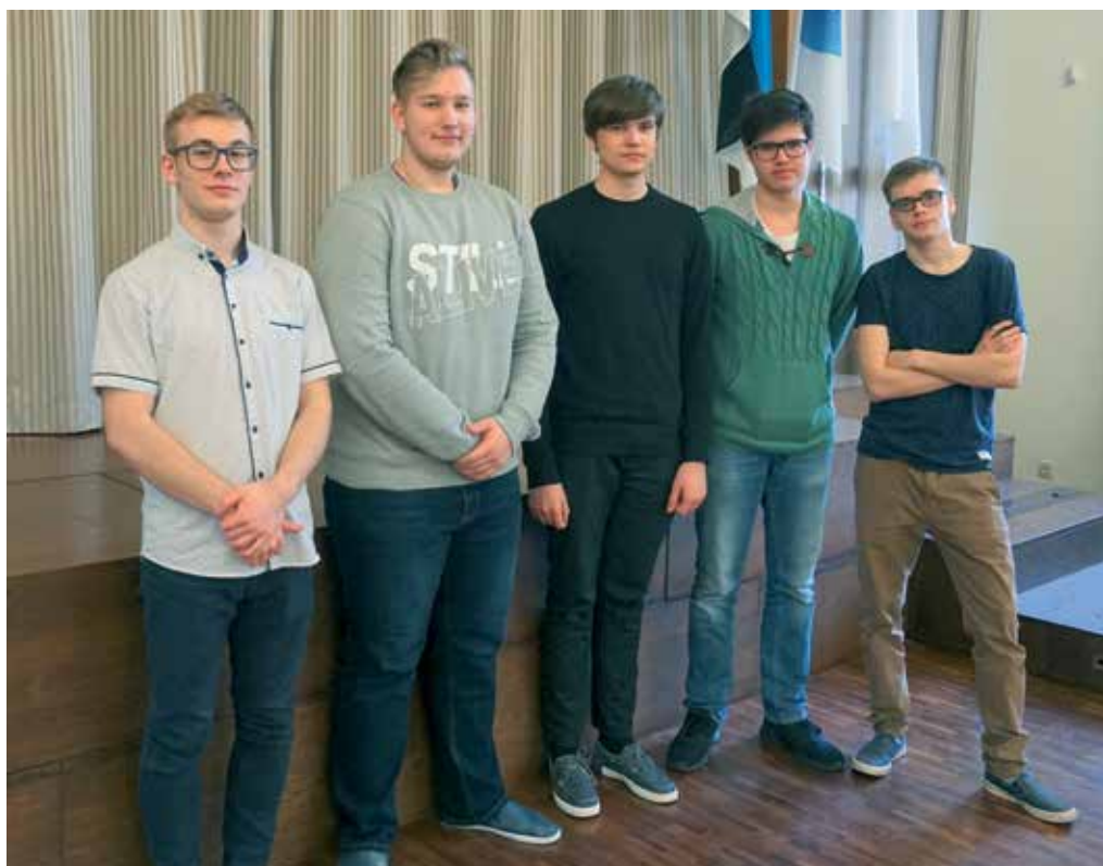
Piirkondlikult majandusõpetuse olümpiaadilt tublid tulemused toonud noormehed