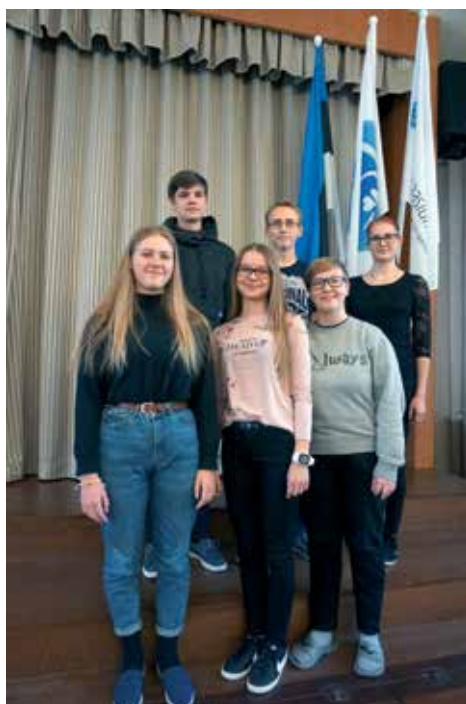
... ja keemias