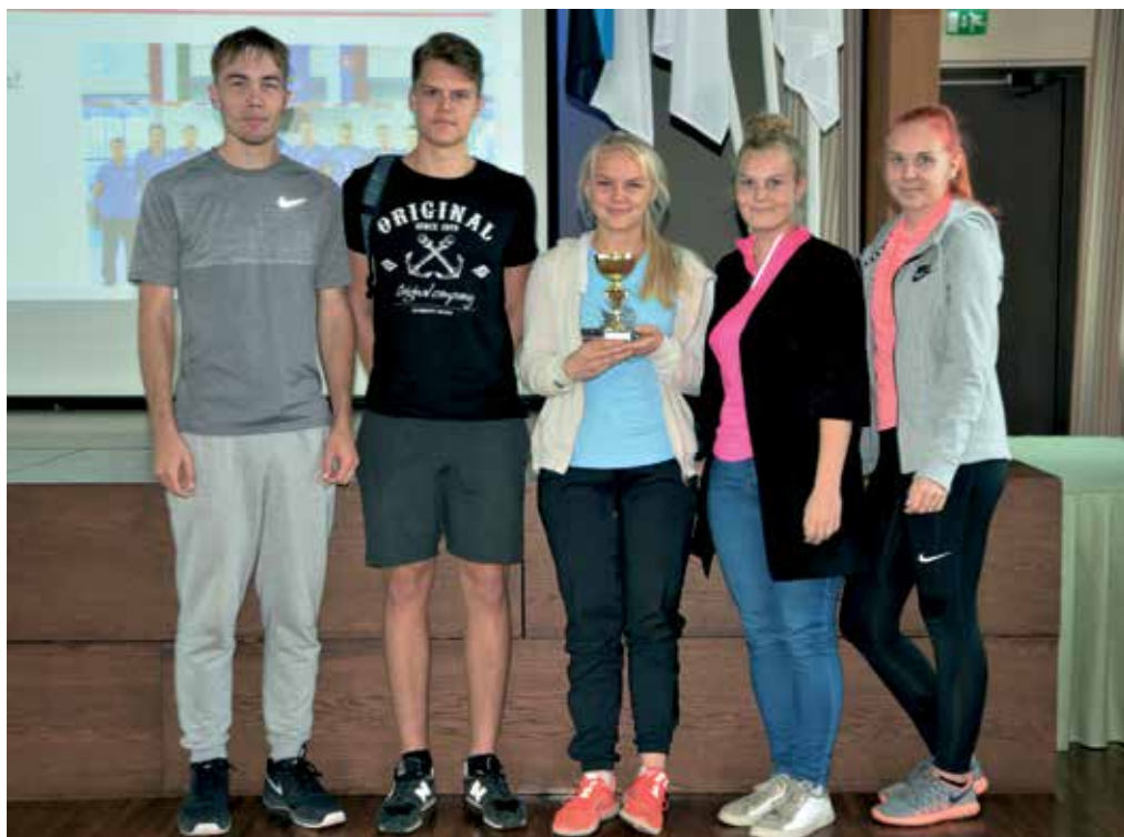
L-klassi särav võistkond pärast spordiviktoriini võitu