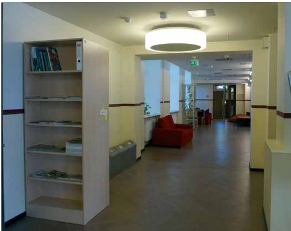
Esimese korruse koridor enne ja nüüd