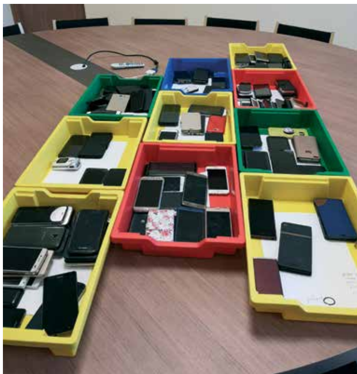
„Saak“ nutivabal päeval