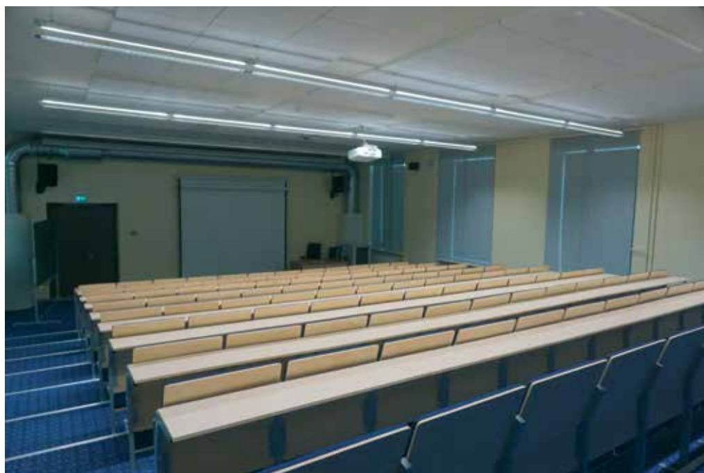
Võimlast sai auditoorium