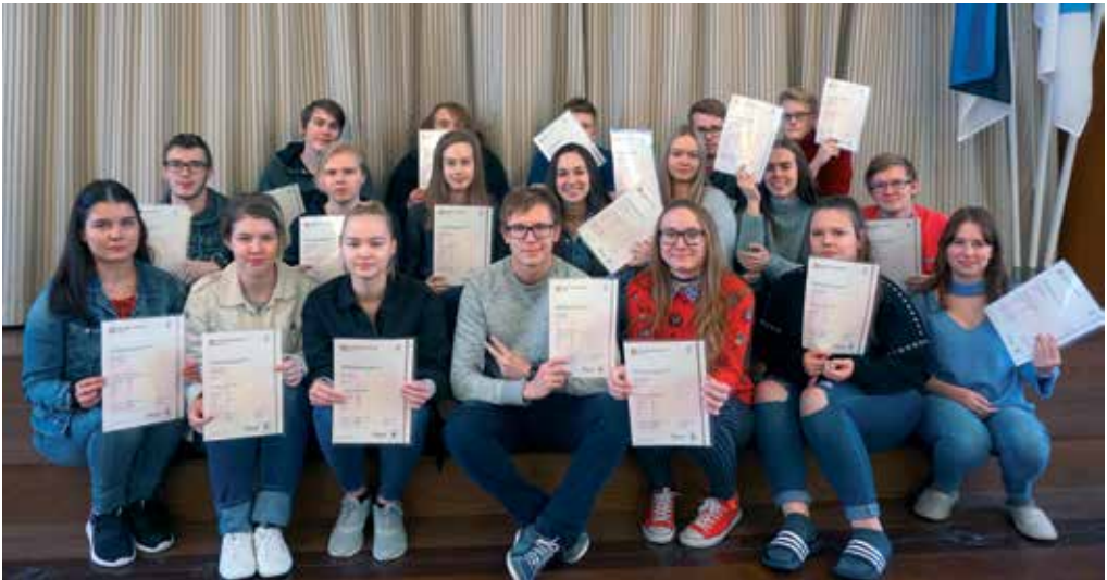
Õnnelikud abiturientid väga hästi sooritatud CAE eksami tunnistustega