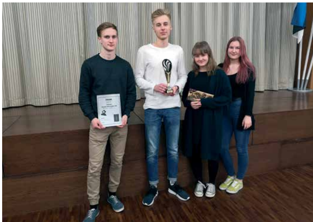
Salongiõhtu "JmG kõige õudsem õudukas 2019" võitis M-klass klipiga "UPT"