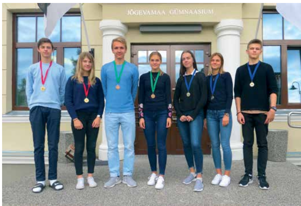
Medalisadu Jõgevamaa noorte meistrivõistluselt sügisjooksukrossis