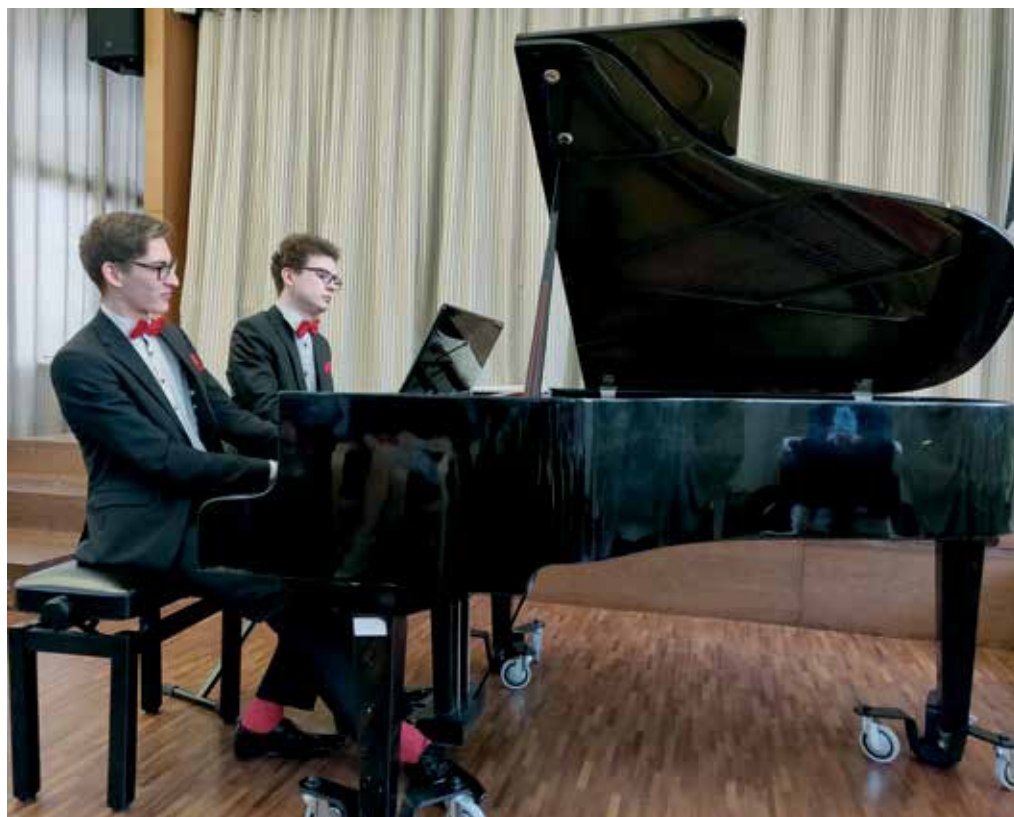
... “Klaverit avastamas”