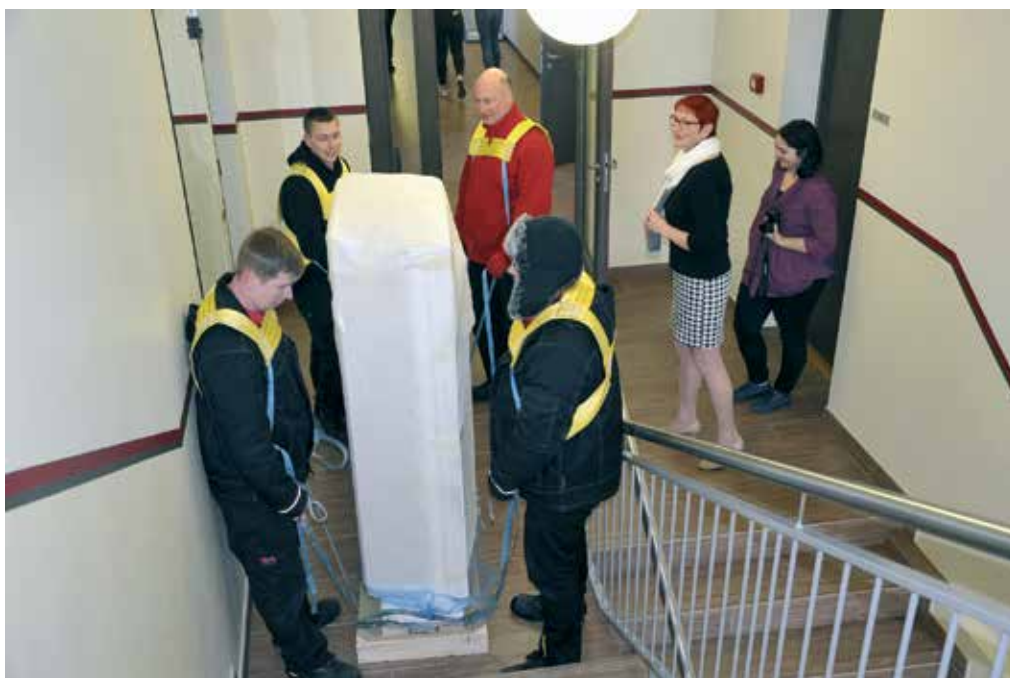
Mõista-mõista, mis siin peidus on?