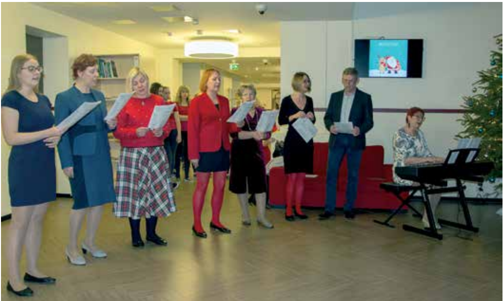
... ja jätkus õpetajate laulu(de)ga