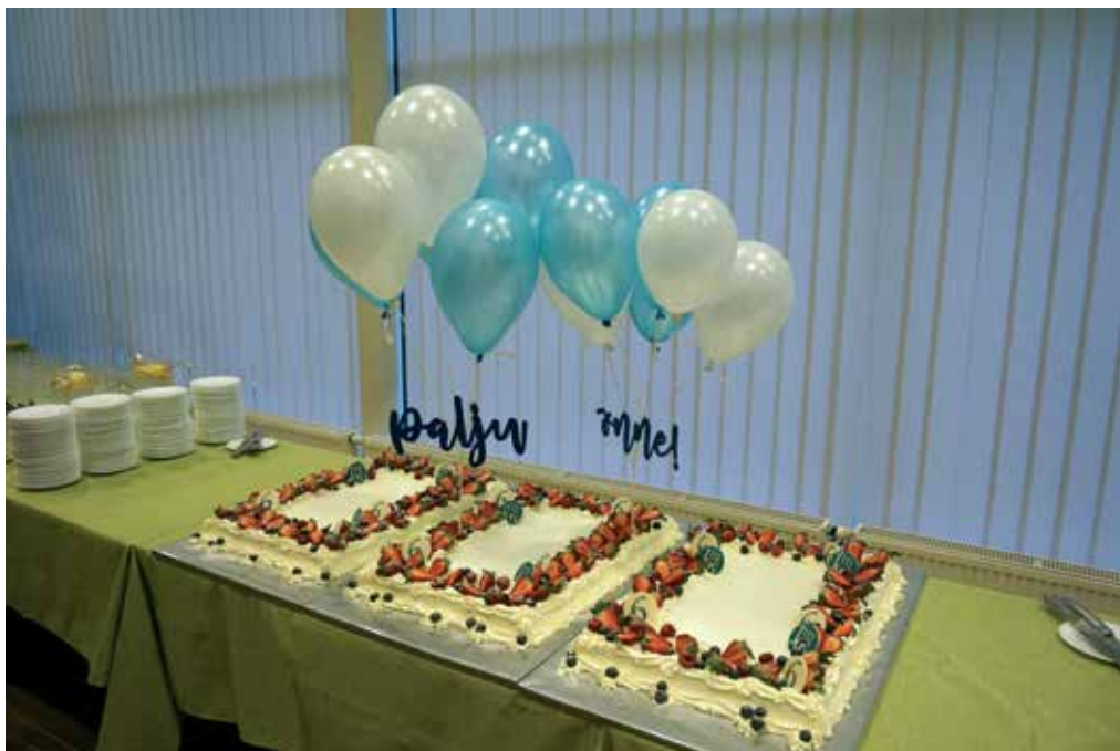
... magusaid hetki kevadkontserdilt